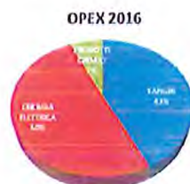
Tabella 5 – OPEX gestione impianti di depurazione - periodo 2013-2016

Anche per la parte economica viene riportata una tabella con indicate le variazioni percentuali riscontrate nel quadriennio analizzato.